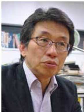
東京大学大学院情報学環教授・ 東京大学出版会理事長 よし み しゅん や 吉見 俊哉氏

1957年、東京生まれ。東京大学大学院情報学環教授。東京大学出版会理事長。1976年に東京大学理科I類に入学後、同大学教養学部教養学科卒業。同大学院社会学研究科博士課程単位取得退学。社会学・文化研究・メディア研究専攻。東大新聞研究所助教授、同社会情報研究所助教授、教授を経て現職。2006～08年度に東大大学院情報学環長・学際情報学府長、2009～12年度に東大新聞社理事長、2010～14年度に東大副学長、同教育企画室長、同大学総合教育研究センター長、同グローバルリーダー育成プログラム推進室長、2010～13年度に東大大学史料室長等を歴任。1993～94年にエル・コレヒョ・デ・メヒコ大学院客員教授、1999年にウエスタン・シドニー大学客員教授、2017～18年にハーバード大学エドウィン・O・ライシャワー客員教授。集まりの場でのドラマ形成を考えるとところから近現代日本の大衆文化と文化政治を研究。演劇論的アプローチを基礎に、日本におけるカルチュラル・スタディーズの中心的存在として先駆的な役割を果たした。主な著書に、『大学とは何か』（岩波新書）、「文系学部廃止」の衝撃（集英社新書）、「大学はもう死んでいる？」（集英社新書）、『東大という思想』（東京大学出版会）、現代思想 2020年10月号 特集＝コロナ時代の大学（青土社）等、多数。