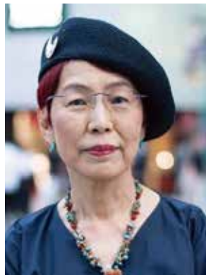
社会学者・東京大学名誉教授・ 認定NPO法人ウィメンズアクション ネットワーク (WAN) 理事長 うえ の ちづ こ 上野 千鶴子氏

1957年、東京生まれ。東京大学大学院情報学環教授。東京大学出版会理事長。1976年に東京大学理科I類に入学後、同大学教養学部教養学科卒業。同大学院社会学研究科博士課程単位取得退学。社会学・文化研究・メディア研究専攻。東大新聞研究所助教授、同社会情報研究所助教授、教授を経て現職。2006～08年度に東大大学院情報学環長・学際情報学府長、2009～12年度に東大新聞社理事長、2010～14年度に東大副学長、同教育企画室長、同大学総合教育研究センター長、同グローバルリーダー育成プログラム推進室長、2010～13年度に東大大学史料室長等を歴任。1993～94年にエル・コレヒョ・デ・メヒコ大学院客員教授、1999年にウエスタン・シドニー大学客員教授、2017～18年にハーバード大学エドウィン・O・ライシャワー客員教授。集まりの場でのドラマ形成を考えるとところから近現代日本の大衆文化と文化政治を研究。演劇論的アプローチを基礎に、日本におけるカルチュラル・スタディーズの中心的存在として先駆的な役割を果たした。主な著書に、『大学とは何か』（岩波新書）、「文系学部廃止」の衝撃（集英社新書）、「大学はもう死んでいる？」（集英社新書）、『東大という思想』（東京大学出版会）、現代思想 2020年10月号 特集＝コロナ時代の大学（青土社）等、多数。